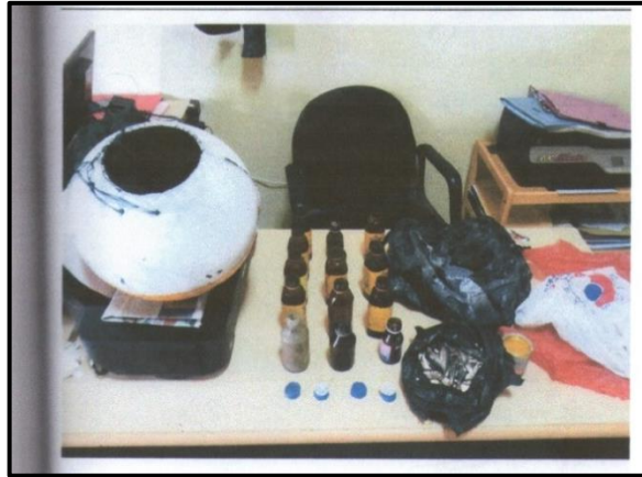
Gambar 3. Bahan Perakit Bom Ikan

Bahan peledak atau bom ikan tersebut berbahan dari racikan bom atau potasium yang telah dicampur dengan Cat Brown, satu kaleng kecil cat brown, satu buah pirek atau pipet kaca, empat buah tutup botol yang terbuat dari bahan sendal jepit berwarna biru dan putih, botol kecil campuran sebanyak 15 (lima belas) botol yang dimasukkan di dalam bekas pelampung.