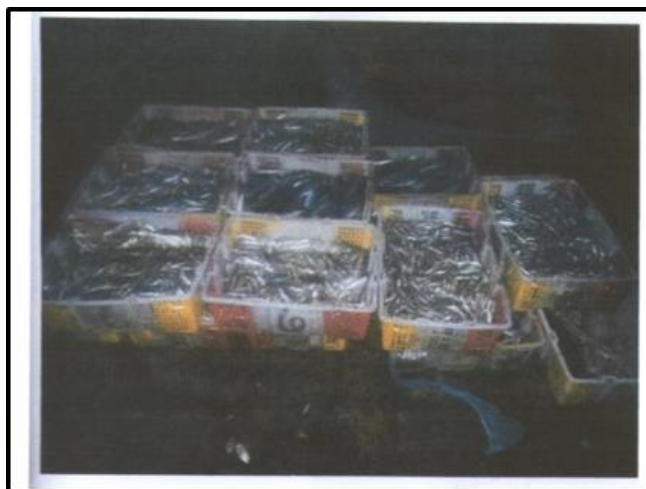
Gambar 2. Ikan Hasil Tangkapan dengan Bom Ikan

lain (detonator, potasium (ampo), serbuk korek api, botol kosong kratingdeng, kaleng cat brown). Mereka pakai sumbu buatan modifikasi yang dililit menggunakan benang jahit yang mirip sumbu buatan pabrik. Untuk penyulut sumbu mereka menggunakan obat nyamuk bakar. Botol bekas minuman berenergi yang berisi bahan peledak (serbuk ampo dan serbuk brown atau pengapian) di tutup menggunakan potongan sandal jepit. Bom ini merupakan high explosive (berdaya ledak tinggi), jika meledak tidak hanya ikan yang mati namun terumbu karang juga hancur 4 . Berikut dibawah ini adalah gambar bahan perakit bom ikan yang diperoleh dari kasus penangkapan tanggal 29 Maret 2016.