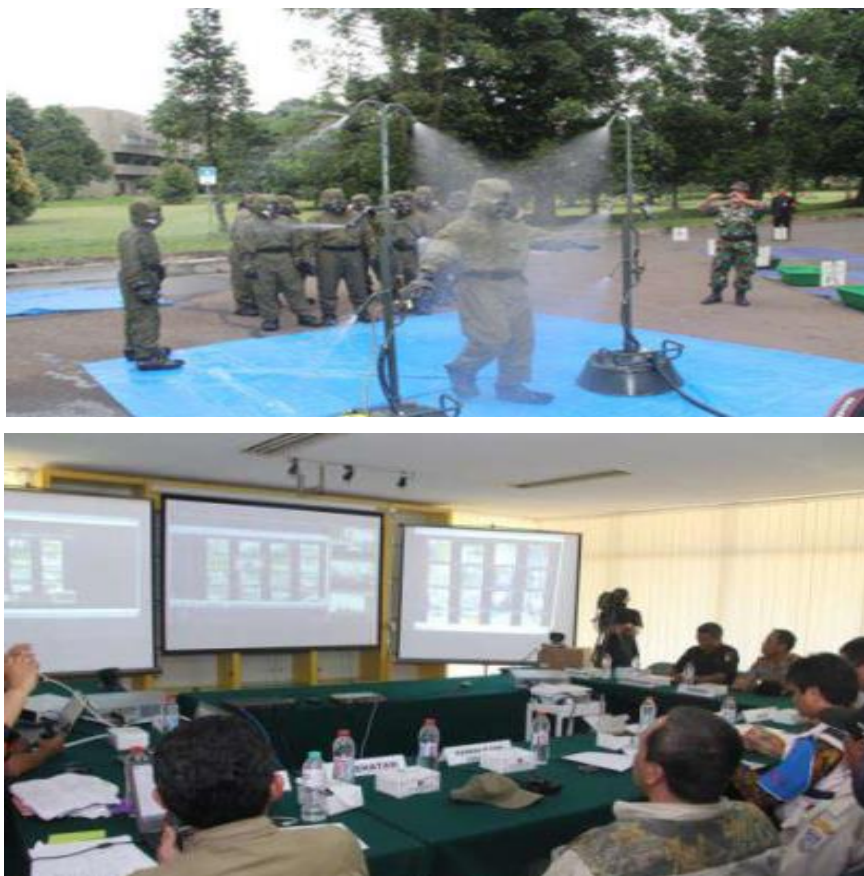
Gambar 7. Latihan Kedaruratan Nuklir

Pelatihan dan/ atau gladi kedaruratan nuklir tingkat provinsi dikoordinasikan oleh Kepala Badan Penanggulangan Bencana Daerah (BPBD) provinsi dan dilaksanakan bersama dengan pemegang izin RSG-GAS beserta instansi terkait berdasarkan program kesiapsiagaan nuklir tingkat provinsi. Pelatihan kedaruratan nuklir tingkat provinsi dilakukan dua tahun sekali dan pelatihan kedaruratan nuklir tingkat nasional dilaksanakan empat tahun sekali sesuai amanah dari Peraturan Pemerintah Nomor 54 Tahun 2012 tentang Keselamatan dan Keamanan Nuklir (BAPETEN, 2012). Pelatihan kedaruratan nuklir nasional dikoordinasikan oleh Kepala Badan Nasional Penanggulangan Bencana Nasional (BNPBN) dan dilaksanakan bersama dengan pemegang izin RSG-GAS beserta kementerian dan/atau lembaga nonkementerian terkait sesuai dengan program kesiapsiagaan nuklir tingkat nasional. Pelatihan kedaruratan nuklir tingkat provinsi dan nasional diberikan dalam Gambar 7 .