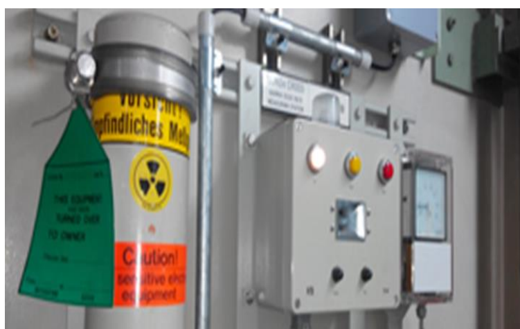
Gambar 5. Sistem Proteksi Radiasi Di Dalam Reaktor