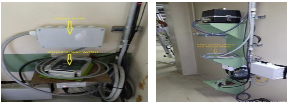
Gambar 4. Titik Pengukuran Basement

RSG-GAS juga dilengkapi sistem deteksi radiasi untuk mengetahui sejak dini apabila terjadi lepasan radioaktif ke lingkungan. Petugas yang bekerja dalam area radioaktif dilengkapi dengan dosimeter personal dan peralatan proteksi radiasi, alat ini berfungsi untuk memberikan informasi nominal besaran radiasi di sekitar petugas bekerja. Sehingga, petugas dapat segera melakukan tindakan tanggap darurat, jika dipertimbangkan radiasi yang diterima pekerja melewati ambang batas 20 mSv per tahun dalam periode 5 tahun, dan 50 mSv dalam 1 tahun tertentu. Selain alat deteksi radiasi yang dimiliki petugas, RSG-GAS juga dilengkapi sistem deteksi radiasi yang dipasang pada ruangan dalam reaktor bertujuan memantau paparan dan aktivitas radiasi di tiap ruang dan sistem diberikan dalam Gambar 5 .