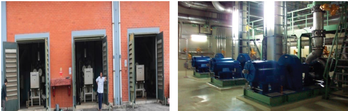
Gambar 3. Tiga Buah Pompa Pendingin Primer RSG-GAS (Kanan) dan Tiga Buah Diesel Generator RSG-GAS (Kiri)