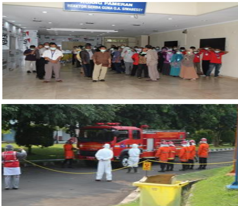
Gambar 6. Pelatihan Kedaruratan Nuklir Tingkat Instalasi di KNS

Pelatihan kedaruratan nuklir dilakukan untuk meningkatkan kapasitas Petugas RSG-GAS, Pemerintah, Pemerintah Daerah, dan instansi terkait untuk menghadapi tanggap darurat bencana nuklir. Pelatihan kedaruratan nuklir merupakan kegiatan mitigasi untuk mengurangi risiko bencana, dilakukan secara berkala untuk mencegah terjadi kegagapan pada saat tanggap darurat nuklir (Ruskar et al., 2022; Syarifah et al., 2020; Tyas et al., 2022; Utama et al., 2020; Widha et al., 2021; Widyaningrum et al., 2020; Yuliarta & Rahmat. 2021). Pelatihan/ gladi kedaruratan nuklir untuk menghadapi ancaman bencana akibat kegagalan teknologi nuklir pada tingkat instalasi telah dilakukan secara berkala 1 (satu) tahun sekali. Pelaksanaan pelatihan dan/atau gladi dilakukan sesuai dengan program kesiapsiagaan nuklir di KNS yang telah ditetapkan. Pelatihan kedaruratan nuklir tingkat instalasi diberikan dalam Gambar 6 .