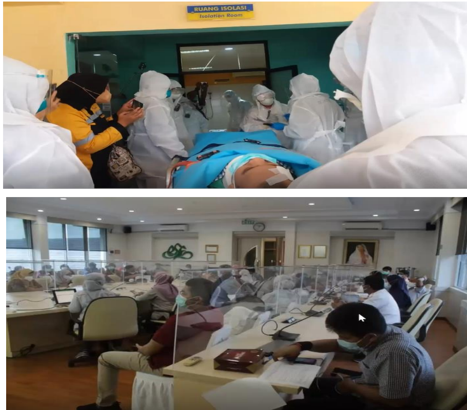
Gambar 8. Latihan Kedaruratan Nuklir Dokkes

HK.01.07/MENKES/420/2018 tentang rumah sakit rujukan bencana nuklir nasional. Rumah sakit yang ditunjuk meliputi rumah sakit Fatmawati, rumah sakit Hasan Sadikin, dan rumah sakit Sarjito. Pelatihan kedaruratan nuklir yang dilakukan oleh BAPETEN dan tiga rumah sakit yang ditunjuk diberikan dalam Gambar 8 .