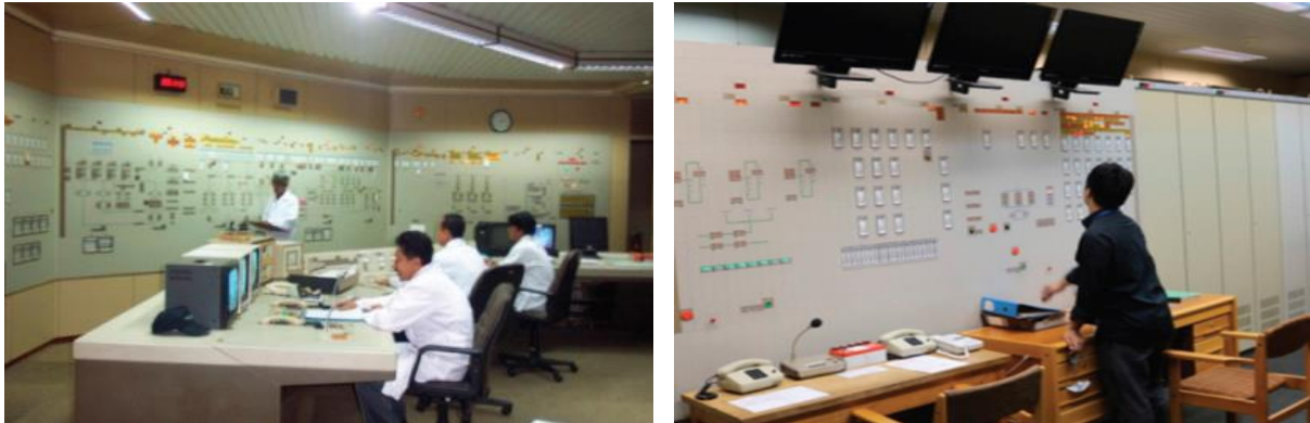
Gambar 2. RKD (Kanan) dan RKU (Kiri)

Gambar 2. Ruang kendali tersebut untuk memantau dan memudahkan operator dalam memadamkan reaktor secara otomatis pada tingkat daya tertentu apabila terjadi anomali. Selain ruang kendali, juga dirancang prinsip fail-safe pada sistem penyedia daya darurat dan sistem pompa pendingin primer diberikan dalam Gambar 3. Sistem backup juga dirancang di RSG-GAS pada sistem kelistrikan yang tidak hanya mengandalkan sumber dari Perusahaan Listrik Negara (PLN) juga didapatkan pada fungsi baterai dan genset darurat.