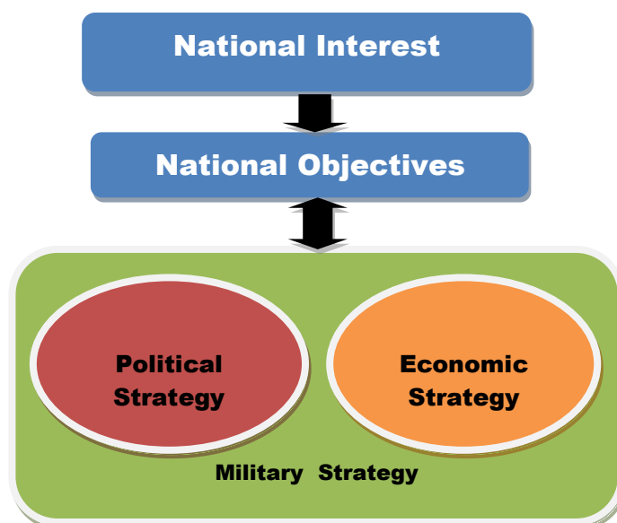
Hubungan Strategi Militer dengan Kepentingan Nasional.

Terkait dengan kepentingan nasional dihubungkan dengan ketiga pilar diatas, dapat dijelaskan secara sederhana dengan bagan dibawah ini. Bagan ini merupakan modifikasi dari bagan Strategy and Force Planning Framework yang terdapat dalam buku Strategy and Force Planning Second Edition, Naval War College tahun 1997.