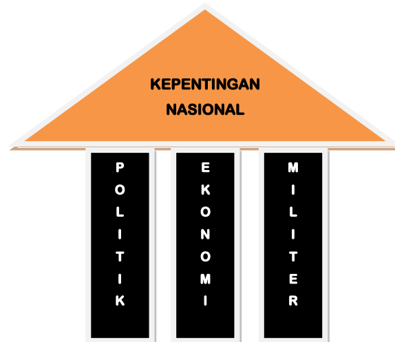
Tiga Pilar Utama Pendukung Kepentingan Nasional.

suatu negara akan ditentukan oleh keterpaduan ketiga hal tersebut. Apabila salah satu pilar rapuh maka akan menurunkan eksistensi dari suatu negara, sebaliknya apabila ketiga pilar tersebut dapat bersinergi dengan baik, maka eksistensi suatu negara akan ikut meningkat. Ketiga pilar tersebut merupakan elemen pendukung utama dari kepentingan nasional sebuah negara, lebih jelas dapat dilihat dalam gambar di bawah ini: